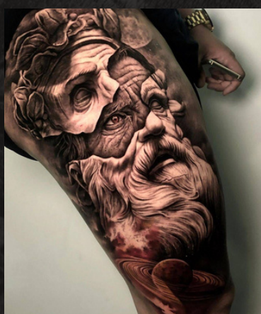
BLACK AND GRAY

SI AÚN TIENES DUDAS SOBRE EL ESTILO QUE QUIERES, TE RECOMIENDO QUE TE MIRES AL ESPEJO Y PIENSES EN COMO DESEAS VISUALIZAR ESTE FUTURO TATUAJE, EXISTEN DISTINTOS ESTILOS EN EL MUNDO DEL TATUAJE.